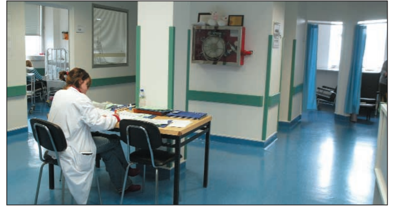
En la imagen, la zona donde se ubican los boxes individuales de la Unidad.

El diagnóstico preciso de esta enfermedad está basado en criterios fijados en el Congreso Internacional sobre Enfermedades Genéticas (Berlín 1986), revisados por un grupo de expertos en 1996 (Gante).